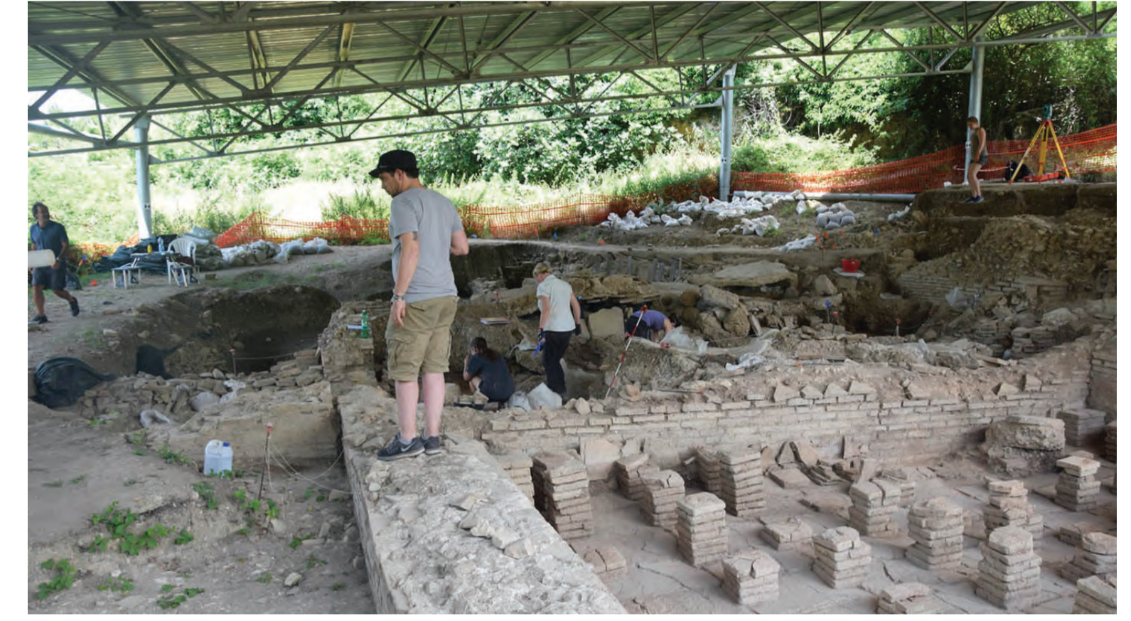
Aree di scavi e di interesse archeologico a Carsulae